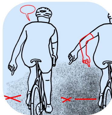
Hindernis klein / Hindernis waagrecht