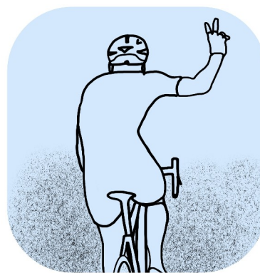
Wir fahren Zweierreihe